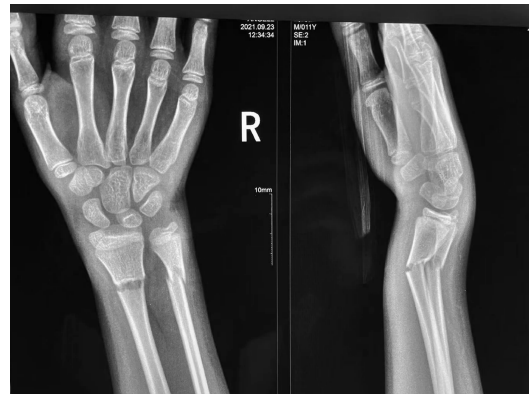
图1 右尺桡骨双干骨折复位前正侧位摄片

二诊:2021年9月30日。患者右前臂肿痛情况好转,神清,精神可,饮食、睡眠一般,舌淡,苔薄白,脉弦细。在原方基础上去桃仁、红花、柴胡、延胡索,加续断10 g,伸筋草15 g进行接骨续筋治疗。14