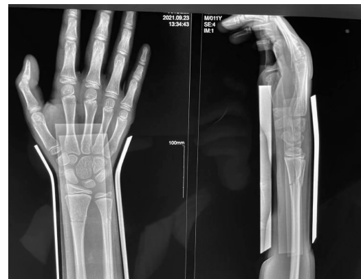
图2 右尺桡骨双干骨折复位后正侧位摄片

剂,煎服法同前,另继续予以院内自制药中药硬膏热敷贴外敷患处,1贴/d,连续治疗2周。并且指导患者在无负重条件下逐步进行功能锻炼。