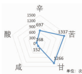
图2 CP中药复方专利药物药味雷达图