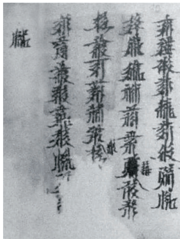
西夏文“治妇人生产后渴不止方”图版

此方共5行，行9字，组方只有一味药材，全方39字，其中第3行残缺3字，第4行残缺2字。